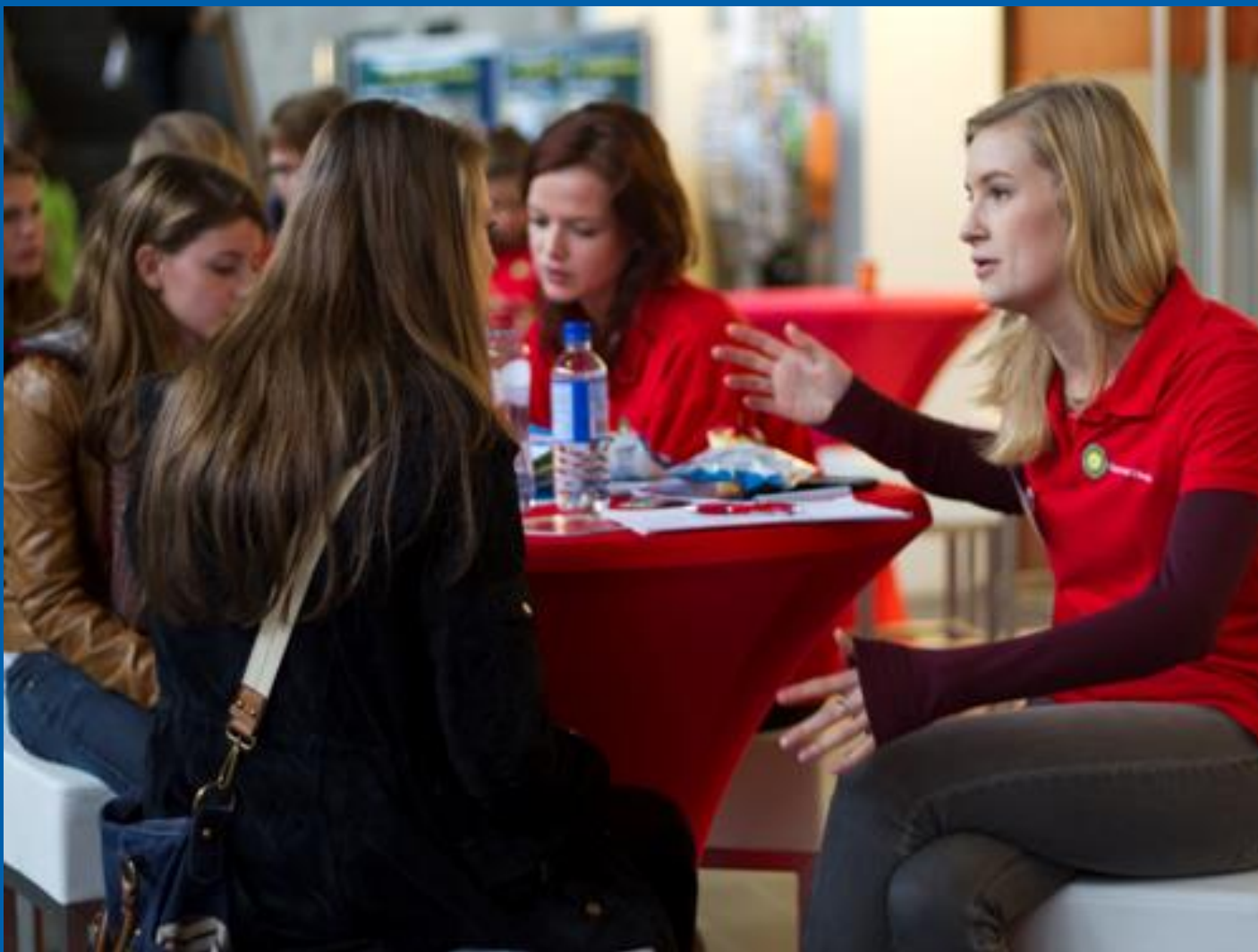
Scholengemeenschap voor mavo, havo en vwo (atheneum en gymnasium)