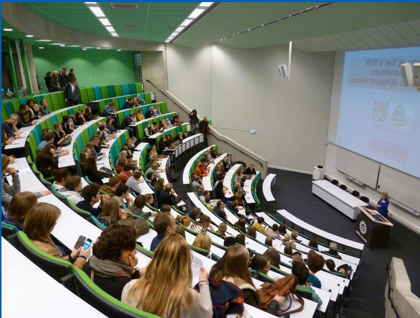
Scholengemeenschap voor mavo, havo en vwo (atheneum en gymnasium)